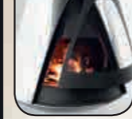
• různé barevné varianty