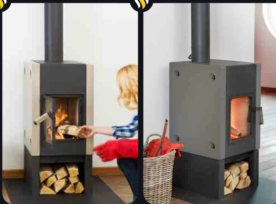
BOXER PLUS BLACK