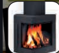
• různé barevné varianty