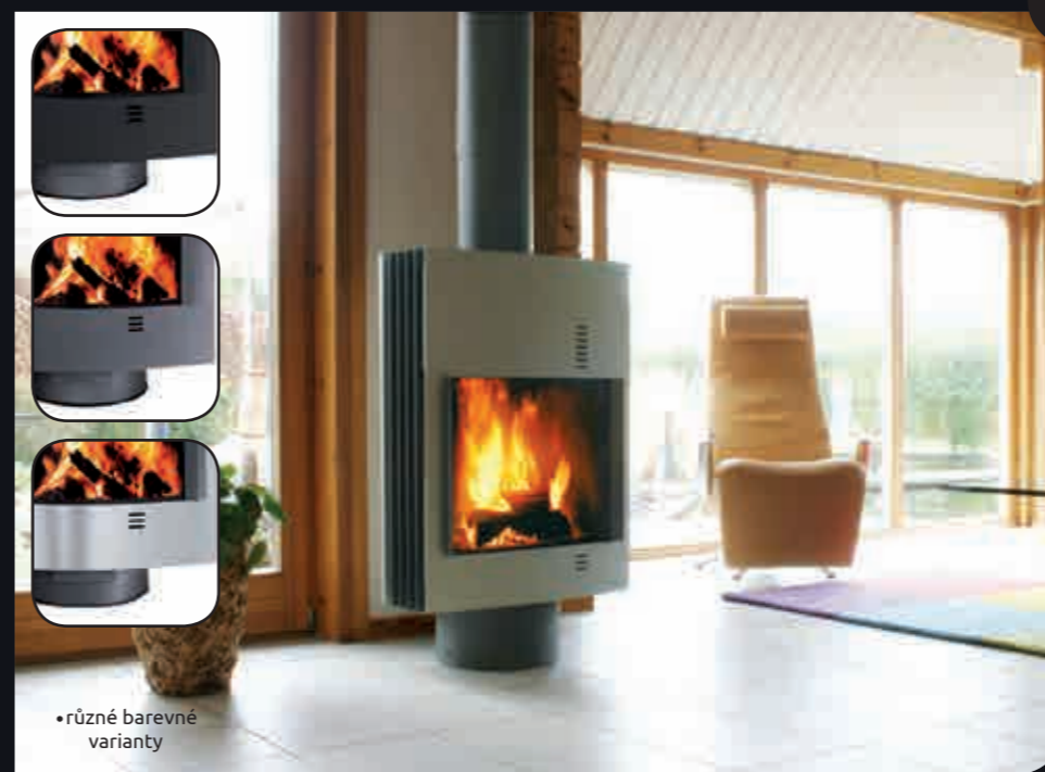
FUGA S (otáčení 360°, 2 x 60° nebo fix)