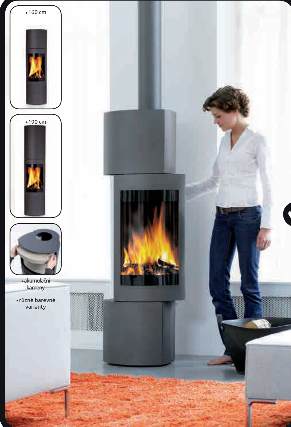
DORAN (otáčení 2 x 45°)