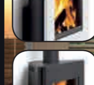
• různé barevné varianty